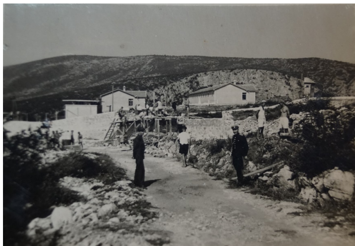
Ил. 2 ЦДА, ф. 370К, оп.8., а.е.280, л.1 - Снимка на селище на Държавна сигурност „Кръсто поле“. 7/9

Темата относно периода на 40-те г. на XX век не е особено проучена. Доминират спомените (на дейци на БКП, които са били интернирани в лагерите преди 09.09. 1944 г. През 1964 г. е публикувано произведението на Вера Мутафчиева 52 – „Женският концлагер Свети Никола – Асеновградско“. То спада по-скоро към литературния жанр, дори пропагандния, но в никакъв случай не може да се нарече историческо изследване. Повествованието се води от първо лице и още в началото е акцентирано върху опозицията – детски лагер през 1940 и по-късно лагер за въдворяване. Неправилно е употребен терминът концлагер, тъй като в документите от епохата тези места за интерниране се наричат „селища на държавна сигурност“. Употребени са характерните за епохата термини: „фашисти“, „фашистки“ 53 по отношение на властта в България преди 09.09.1944 г. Те имат за цел по-скоро да акцентират да натоварят разказа с емоционален заряд, отколкото да допринесат към него исторически. Действията на властта спрямо комунистите са представени едностранно, с презумцията че комунистите са преследвани, арестувани и интернирани неправомерно. 54 Езикът е експресивен, а повествованието наситено с прилагателни и епитети.