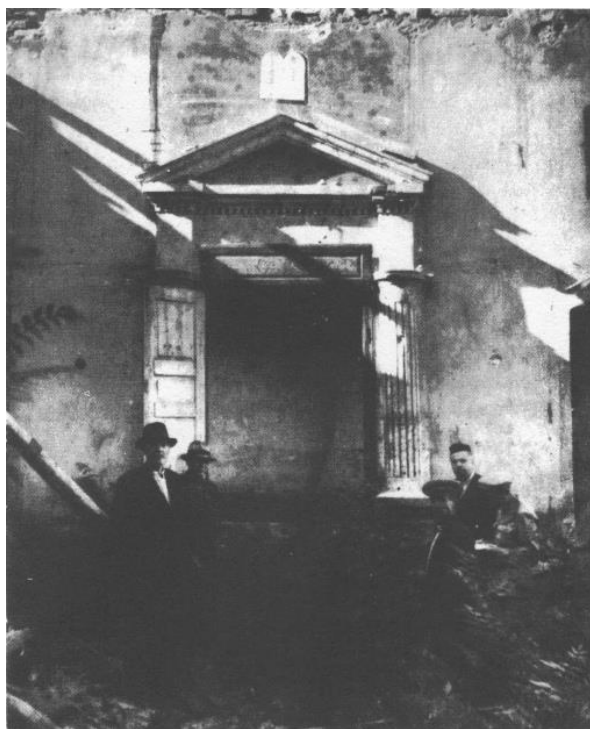
Последната синагога на Никопол „маран бейт Йосеф“ основана от Йосеф Каро през XVI век., Никопол

В годините 1523-1536 равин на сефарадската община е Йосеф Каро – един от най-големите авторитети в съвременния юдаизъм. В Никопол той се оженва за дъщерята на местния романиотски равин Хаим Ал-Балгар. Основаната от него равинска школа (йешива) продължава да служи за синагога до средата на XX век под името „маран бейт Йосеф“. Както се вижда от таблицата, това е периодът, в който еврейското население на Никопол е най-многобройно.