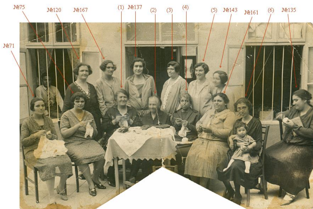
Основателките на ВИЦО – Никопол, 1929 г. Номерирани са според списъка в Приложение IV. (1) до (6) са неизвестни.