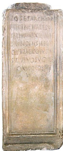
Надгробен паметник на Йосес Архисинагогус, Улция Ескис (с. Гиген). II в. от н. е.

Първи сведения за броя на еврейското население в Никопол има в един османски регистър от 1516 г. 5 По-надолу съм направил опит да съставя таблица на числеността на евреите в града от XVI до средата на XX век. Трябва да отбележим, че данните за броя на евреи в града през Средновековието са откъслечни и неточни. Не се знае количеството им през периода на Второто българско царство. Малкото данни от Османския период са най-вече от данъчни регистри за джизие и порядко от сведения на пътешественици. Тук искам да изкажа особена благодарност на историка-османист д-р Григор Бойков, чиито критични забележки ме подтикнаха да се задълбоча в изследването на въпроса и така да получа една що-годе достоверна представа за големината на еврейската общност в града през този период.