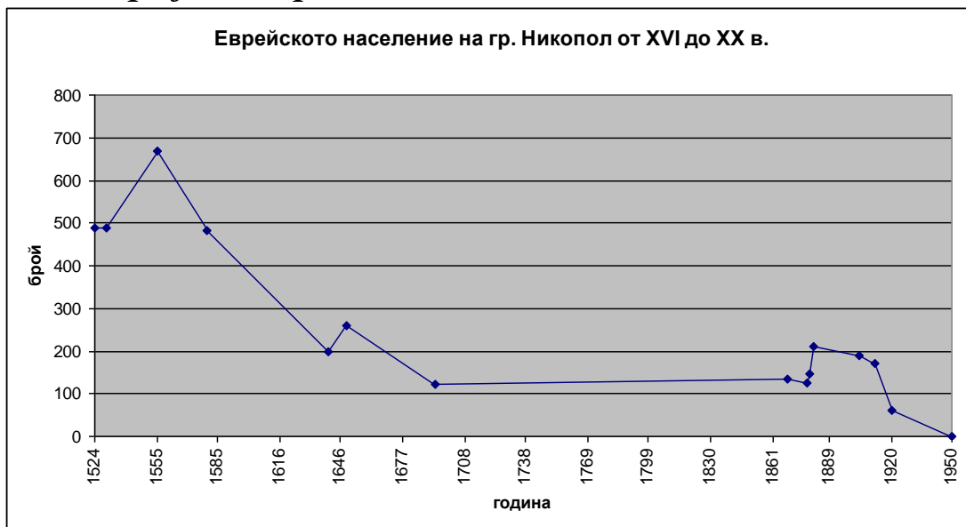
Фиг. 2. Графично представени данните изглеждат така: