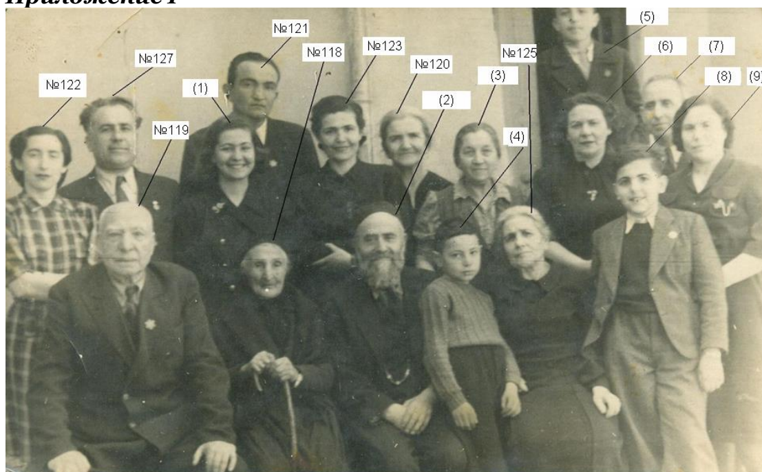
Семейства Ашер, Яков и Телико (№ 117 до № 129) фотографирани преди заминаването на част от тях в Палестина, април 1944 г., Русе.

Никополчани са номерирани според списъка в Приложение IV