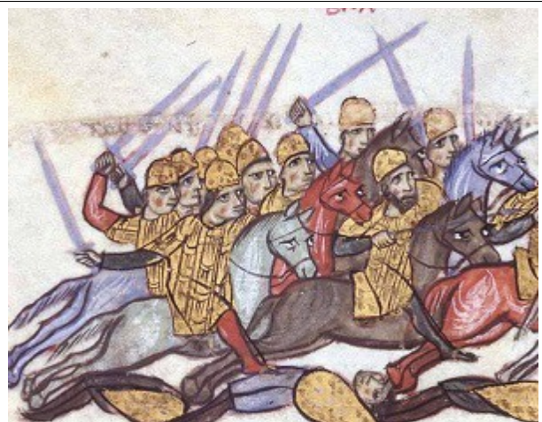
Фиг. 14, Художник В, fol. 122r