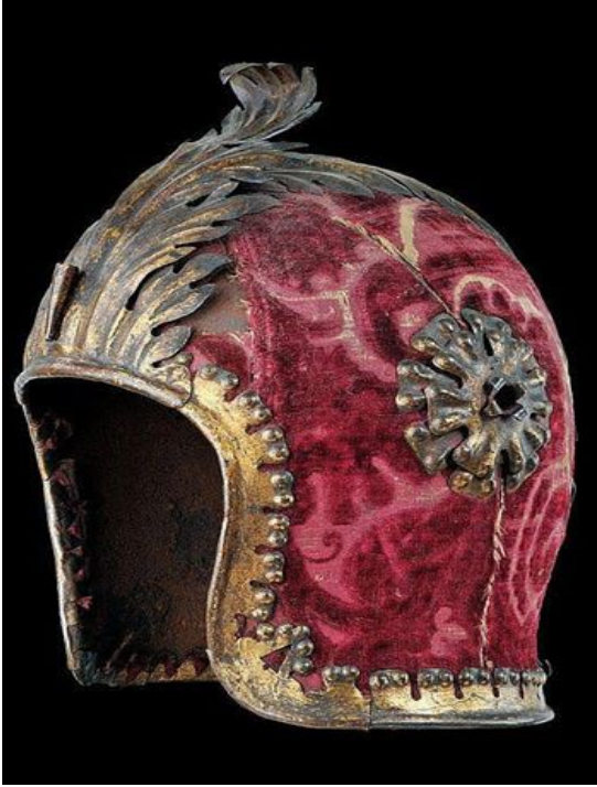
3. Венециански параден шлем (салет) - 14.-15. век