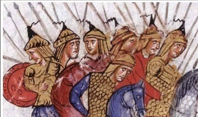
Фиг.1, Художник А, fol. 054v