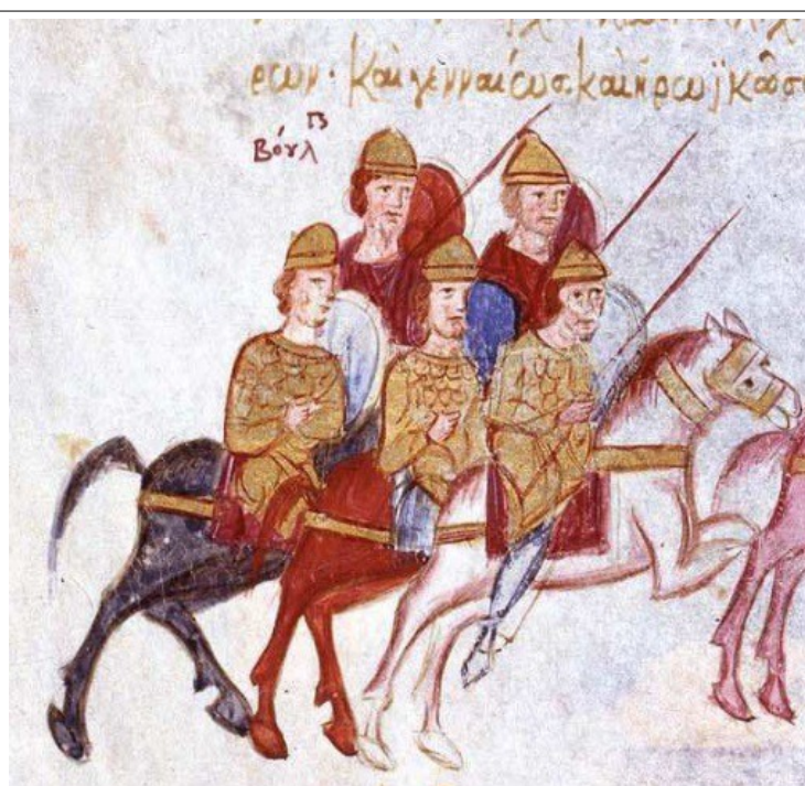
Фиг. 21, Художник С, fol. 184v

В няколко миниатюри на художник Б, изобразяващи триъгълна атакуваща формация се среща твърде любопитен детайл. Конниците в задния ред са се приготвили да хвърлят копията си, вместо, подобно на другарите си от предните редици да ги държат в ръка. (Фиг. 22)