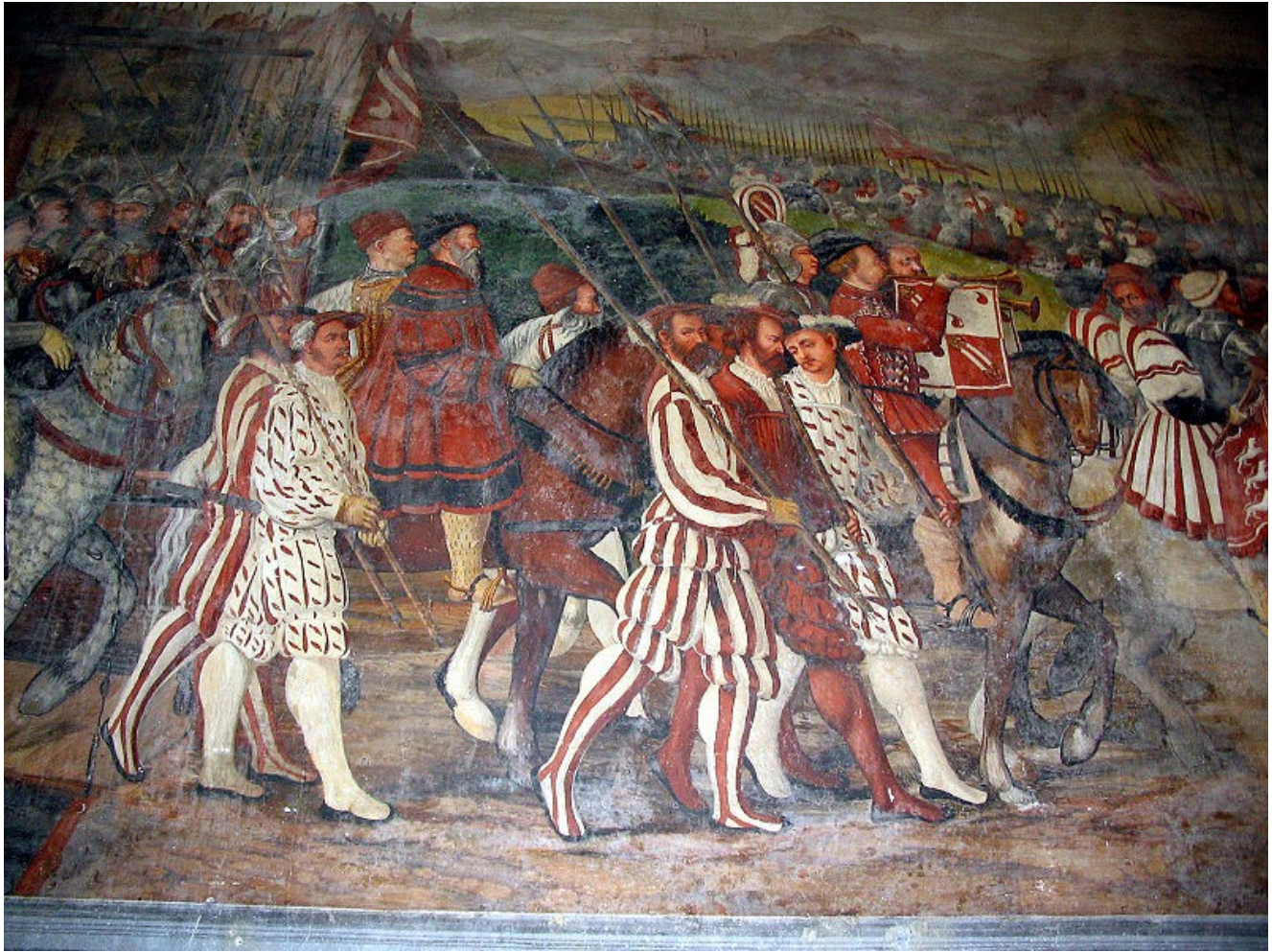
8. Наемна армия - фреска, 15.-16. век