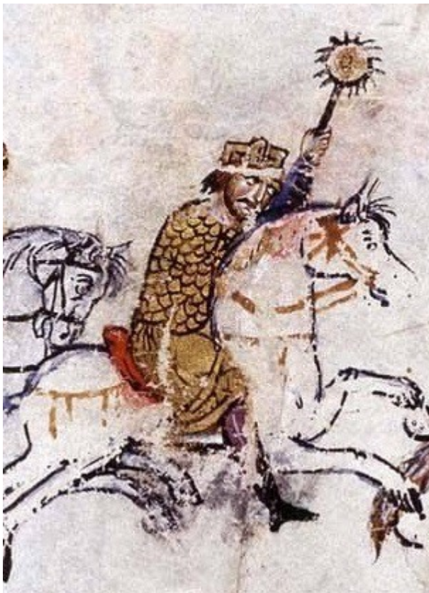
Фиг. 15, Художник А, fol 086r-2