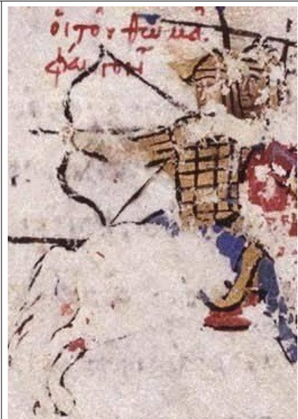
Фиг. 19, fol. 036r

Броните и шлемовете, както и участието в смесени с копиеносци отряди категорично определят тежковъоръжените конни стрелци като ромеи, а не като номадски съюзници. Последните все пак може би са изобразени в fol. 059, където виждаме отряд конни стрелци с кожени шлемове без защита за тила и без брони. (Фиг. 19). Те ясно се различават от досега описваните византийски конници.