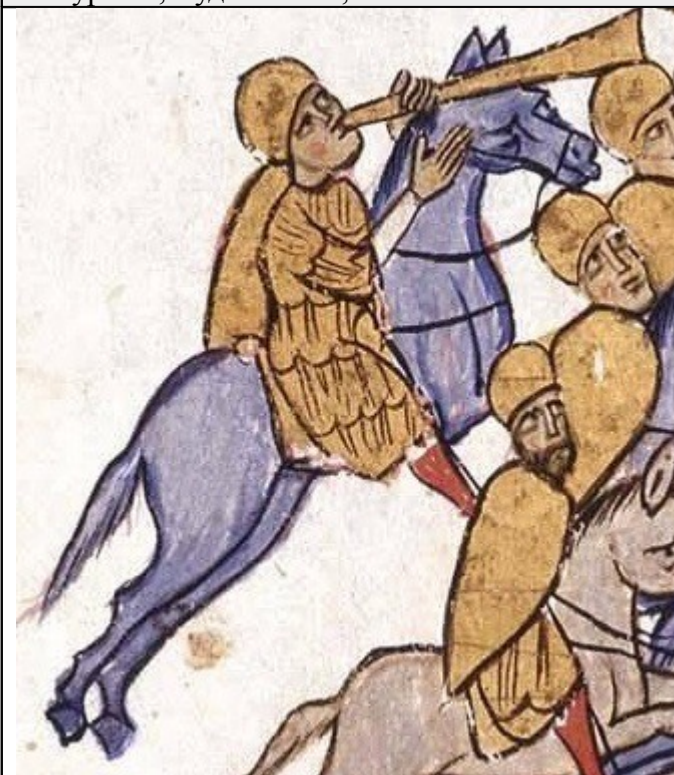
Фигура 24, Художник В, fol. 108v.

Очевидно функцията му е подобна на тази на корнета в кавалерията от XVIII-XIX в., а именно да подава сигнали за настъпление и отстъпление и евентуално за престоляване на отряда. Обичайната му позиция в тила на формацията му позволява да има поглед върху развитието на сражението и да реагира своевременно.