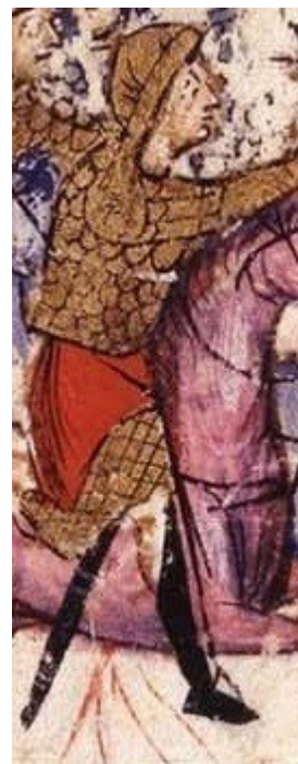
Фиг.11 Художник А, fol. 012r-2

Най-пълната защита за тялото освен нагръдник включва също ламеларни ръкави, достигащи до лакътя и също такава защита за корема, стигаща до колената. Само при художник А се среща долен слой защитно въоръжение, видимо под долната част на туниката и под лактите до китките, интерпретирано от Хофмайер като плетена ризница. Пак само при него се срещат и кръгли метални нараменници. (Фиг. 11)