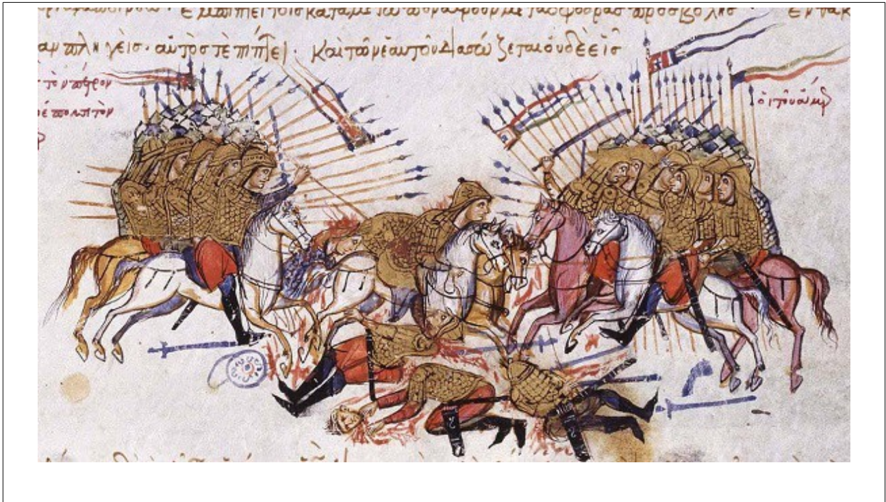
Фиг. 12 Художник А, fol 073v

Техниките на боравене с копие са доста разнообразни, но като цяло то не се използва за хвърляне. Когато конниците са в група, предпочитаният и от тримата художници начин за атака е с копие под мишница, характерен и за западните рицари похват. При индивидуални действия се среща вдигнато до главата копие за удар от горе на долу. (fol. 34v.), с отпусната надолу ръка за удар от долу нагоре (fol. 145v., 228r.) При стандартната за миниатюрист В схема на конно сражение някои от конниците от последния ред държат копията си в положение за хвърляне (fol. 108v, 112v., 135v) Въпросните копия не се отличават като тип от останалите.