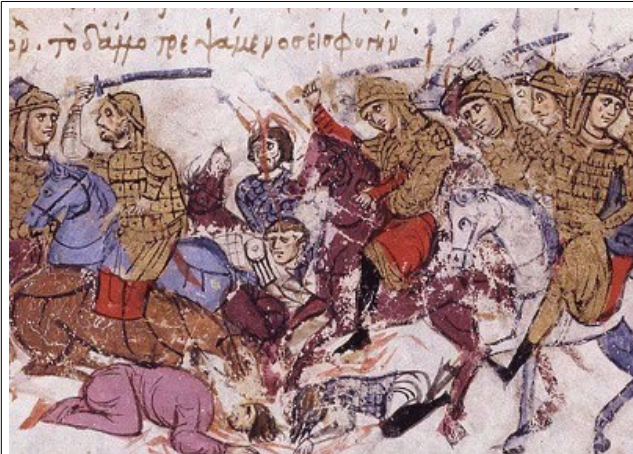
Фиг 13, Художник А, fol. 031r-2

и едноостри оръжия, най-вече при художник А. В Praecepta Militaria сабите са вторично оръжие на катафракта, заедно с правия си двуостър събрат. Мечовете се използват от конниците само за сечене при близка дистанция. Използваните техники са основно две. Първата е прав удар, отгоре на долу, с изнесена над глава ръка. (Фиг. 13) При втората техника ръката се изнася встрани от тялото и във финалната фаза на удара мечът би заел хоризонтално положение. (Фиг. 14)