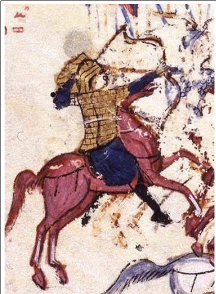
Фиг. 17, fol. 011v

Използваното оръжие в миниатюрите е без съмнение сложносъставен лък. Използвани са три техники на стрелба: с право мерене (Фиг.17) с парабола (Фиг. 18) и изстрел назад (Фиг. 19) Последната техника говори за изключителното майсторство на ромейския стрелец, идентично с това на номадските конни народи. Любопитно е, че при фиг. 18 конниците обстрелват крепост.