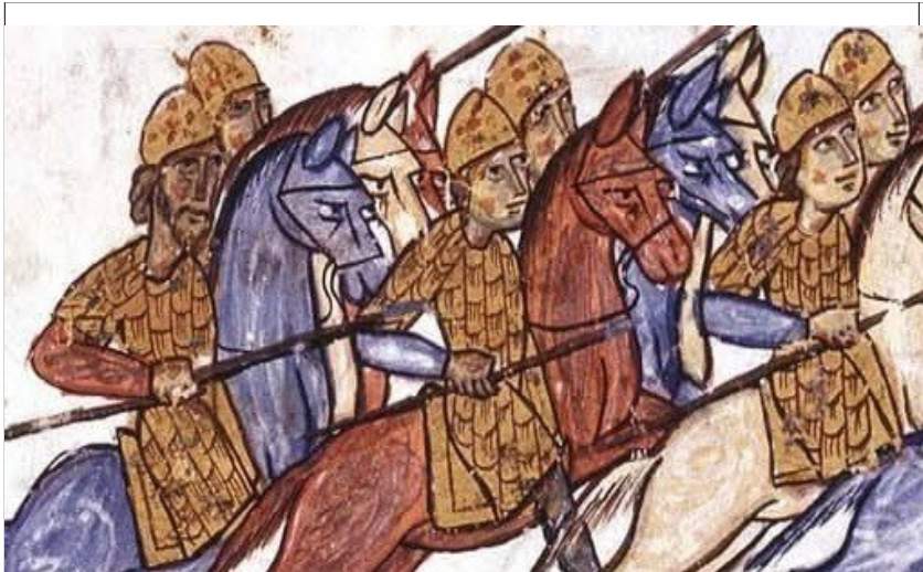
Фиг.9 Художник В fol. 136v