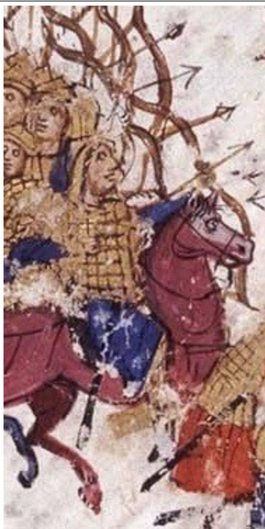
Фиг. 18, fol. 032v-1