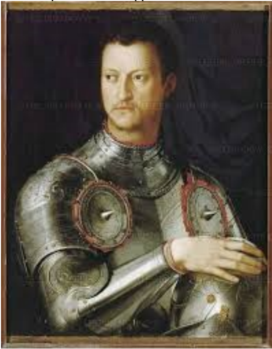
7. Портрет на Козимо I Медичи (1537-1574)