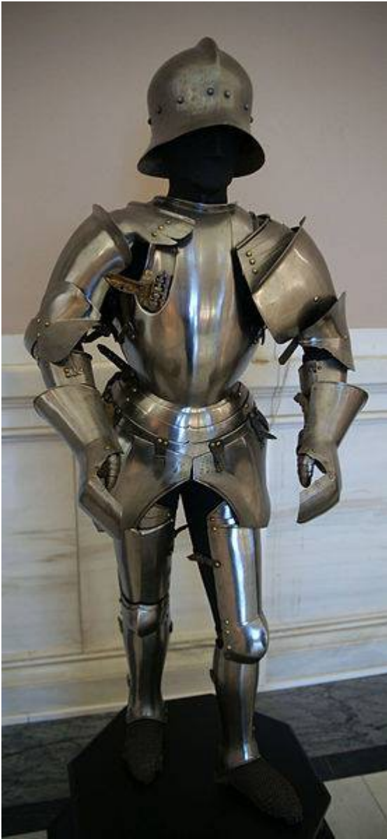
5. Въоръжение на кондотиер от Италия - 15. век