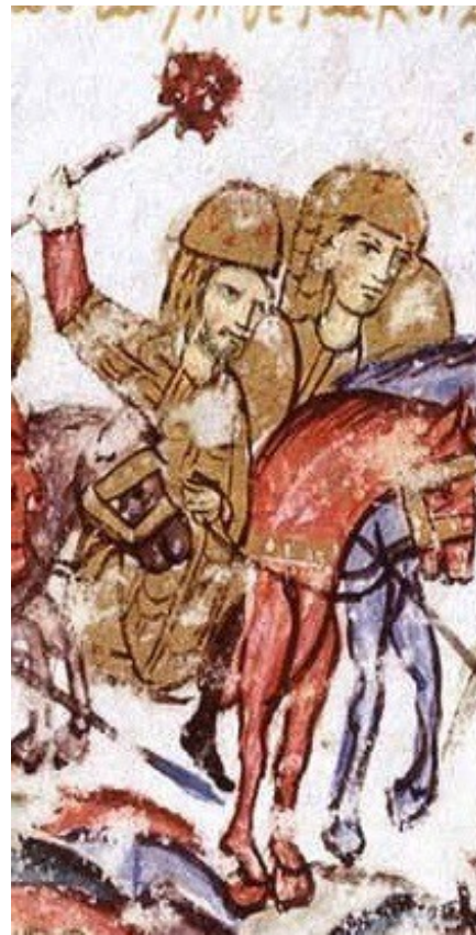
Фиг. 16 Художник В, fol.202v

Всички изобразени боздугани имат остриета по своята повърхност, което съчетава пораженията от натъртване с пробождане, което напълно съвпада с предписанията на Praecepta Militaria: „железни боздугани с изцяло железни глави – главите трябва да имат остри върхове“