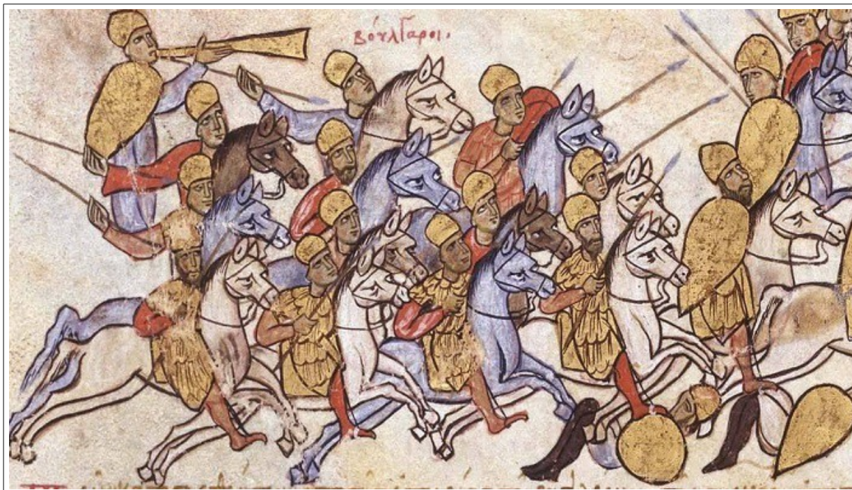
Фиг. 22, Художник В, fol. 108 г.

Подобен похват е напълно реалистичен при конна формация, наредена в дълбочина. Малко вероятно е воините от петия ред, в случая, да могат да използват копията си в директния сблъсък, затова те се използват като метателни оръжия. Подобна техника, според ограничените ми познания, не е описана в писмени извори от периода.