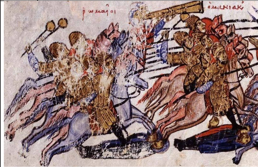
Фиг. 23, Художник В, fol. 213r.

Конниците с боздуганите са в средата на редицата, обградени от копиеносци. Подобна комбинация на копиеносци с воители с боздугани отново срещаме в Praecepta Militaria : „от петата редица до края катафрактите по фланговете трябва да бъдат наредени така – един човек въоръжен с копие и един въоръжен с боздуган“