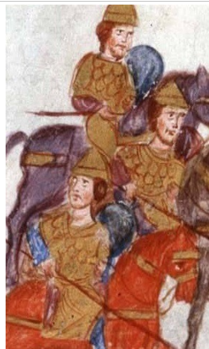
Фиг.10 Художник С, fol.161

Най-пълната защита за тялото освен нагръдник включва също ламеларни ръкави, достигащи до лакътя и също такава защита за корема, стигаща до колената. Само при художник А се среща долен слой защитно въоръжение, видимо под долната част на туниката и под лактите до китките, интерпретирано от Хофмайер като плетена ризница. Пак само при него се срещат и кръгли метални нараменници. (Фиг. 11)