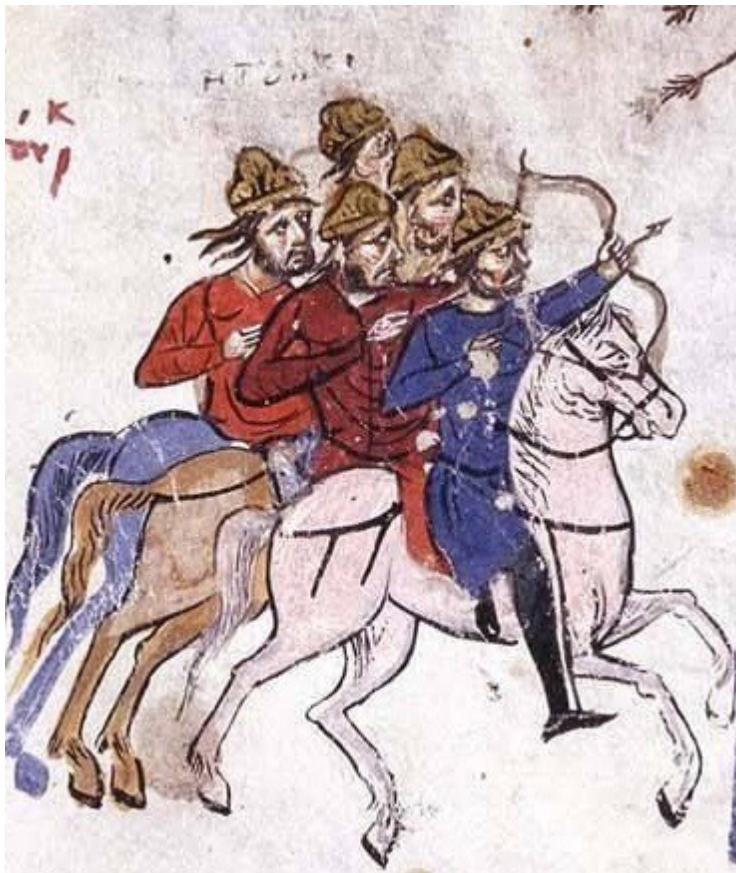
Фиг. 19, fol. 059 v.

Какво можем да научим от досега направения преглед на тежковъоръжения конник от миниатюрите на Мадридския ръкопис на Скилица?