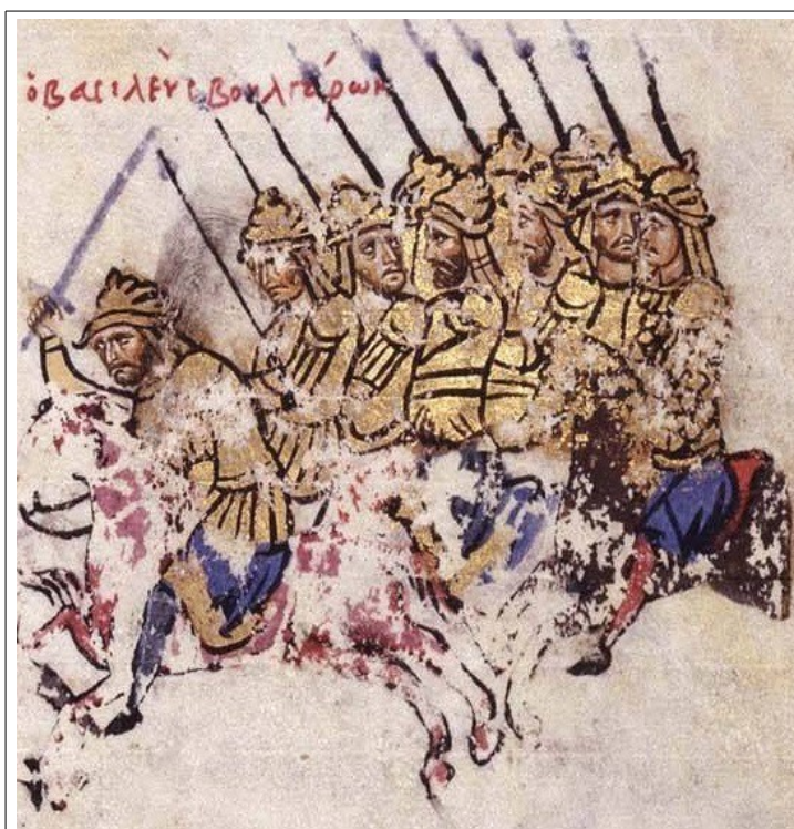
Фиг. 20, Художник А, fol. 035v-1

Подобна клиновидна атакуваща формация е изобразена и от тримата основни художника. (Фиг. 20, 21 и 22). Малко вероятно е всички те да са запознати с византийските военни трактати, съставени близо два века преди илюстрирането на хрониката и предназначени за висши ромейски военачалници. Дори да допуснем обратната хипотеза, бихме очаквали това книжно влияние да се отрази и върху нарисуваните воители. Т.е. те биха приличали повече на катафрактите от текстовете. Според мен, триъгълната конна формация е широко използвана по времето на илюстрирането на хрониката и включването ѝ в миниатюрите от всички художници отразява реалния от XII в.