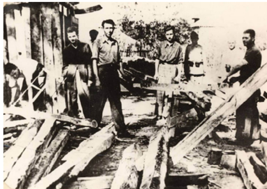
Чаушеску и други политически затворници в трудовия лагер Търгу Жиу, 1943 г.