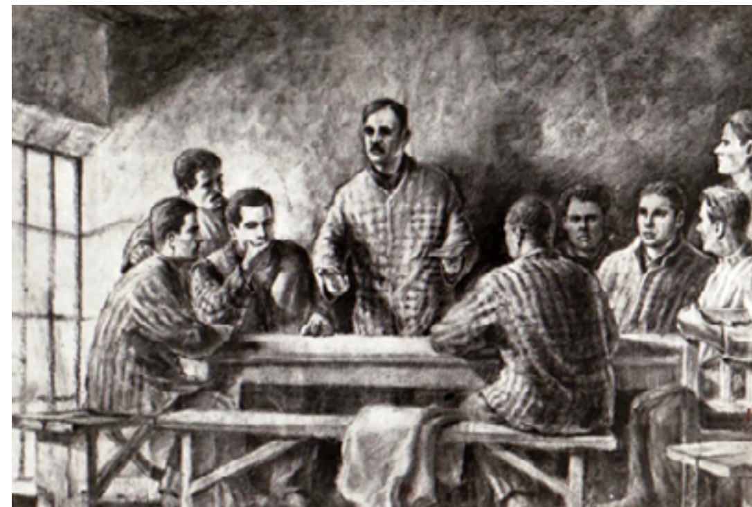
Деж говори пред останалите на събрание на затворниците в Дофтана, 1938 г.

Всичко това води до формирането на една сериозна група около Деж, в която освен вече споменатите млади и неопитни дейци влизат още много хора, които по-късно, след като Георге Георгиу поема управлението на партията, ще станат част от ръководния елит на страната. Сред тях са Лука Ласло (Василие Лука) и Думитру Петреску, бъдещи финансови министри, Емил (Емилиян) Боднараш, по-късно министър на отбраната, Пантелеймон Боднарешко – съветски шпионин, който през 1948 г. става шеф на Секуритате 11 под псевдонима