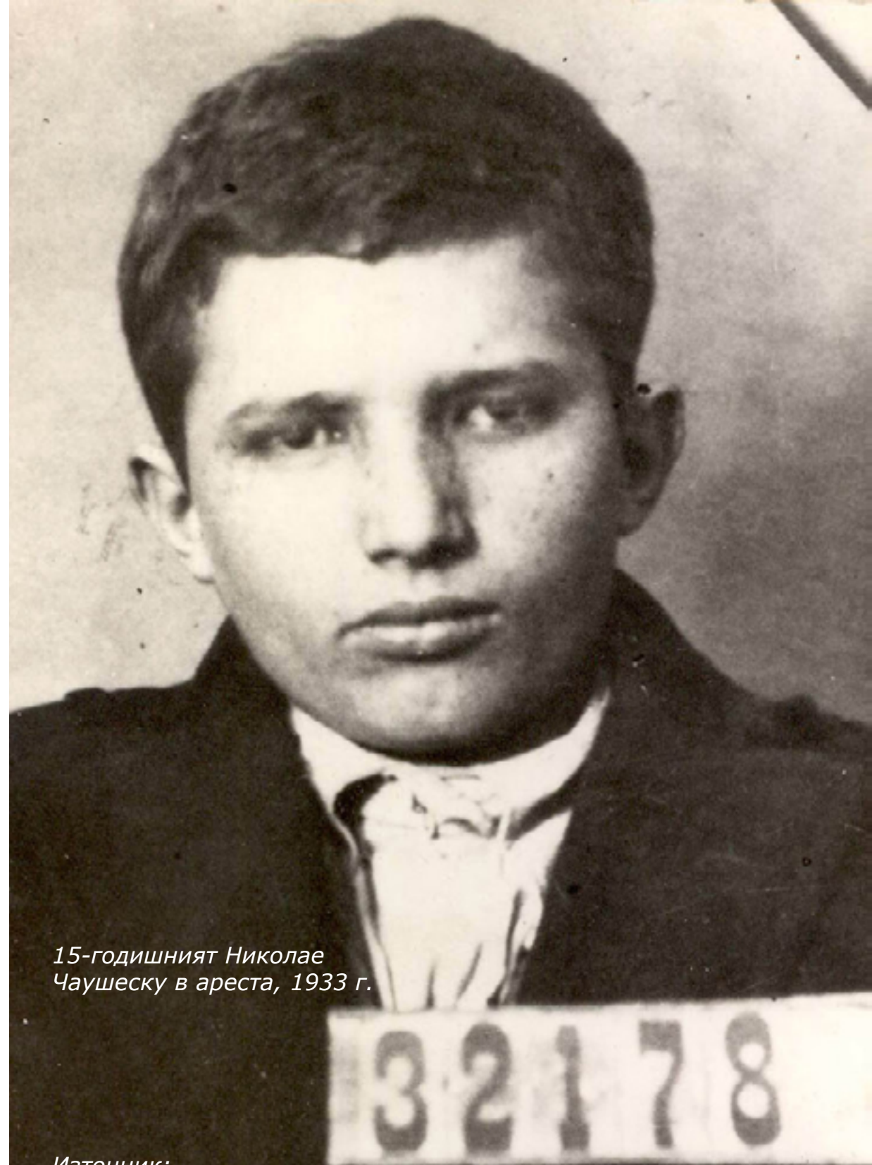
15-годишният Николае Чаушеску в ареста, 1933 г.